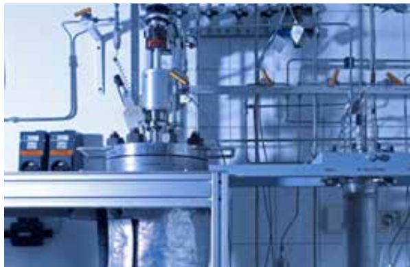
Рис. 3 Пилотная установка ЭДЛ в Лейпциге, Германия

При этом для выбора технологии мы можем определить на нашей пилотной установке всю цепочку растворителей от C_3 до C_6 .