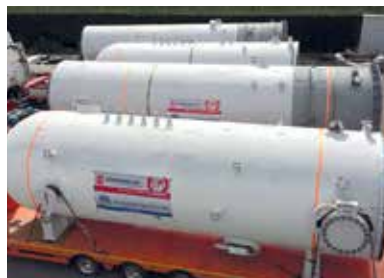
Рис. 4: ОАО «Нафтан», Новополоцк, Беларусь: проектирование и поставка двух экстракционных колонн для реконструкции установки деасфальтизации гудрона пропаном