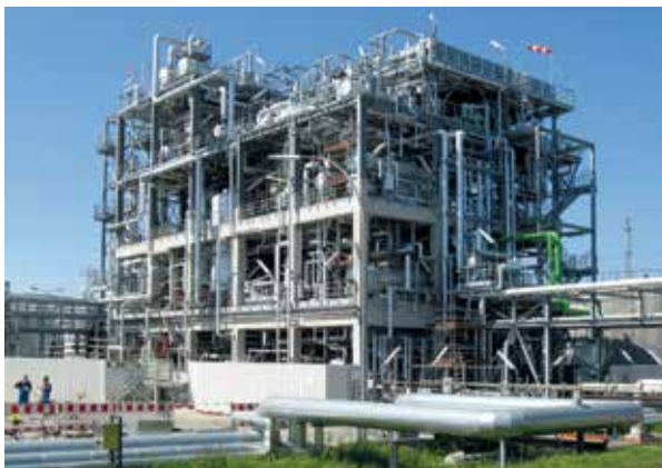
Abb. 1: Propanentasphaltierungsanlage (PDA), H&R Ölwerke Schindler GmbH, Hamburg, Deutschland

Beim Solvent Deasphalting werden in einer Extraktionskolonne die Asphaltene aus den Einsatzprodukten entfernt. Das dabei entstehende entasphaltierte Öl (DAO) wird in weiteren Verfahrensstufen zu Basisölen oder Kraftstoffen verarbeitet. Der anfallende asphaltenreiche Pitch kann zu Bitumen mittels Biturox®-Verfahren oder mittels Blending weiterverarbeitet werden, je nach eingesetztem Rückstand und benötigter Bitumenqualität. Mit "SDA PLUS" bieten wir eine SDA-Technologie sowohl für unterkritischen als auch