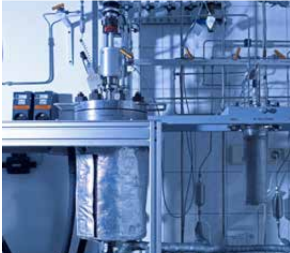
Abb. 3: Pilotanlage der EDL in Leipzig, Deutschland

Diese Pilotversuche bilden die Grundlage für eine optimale Lösung auf Basis der gestellten Qualitätsanforderungen und ermöglichen unseren Kunden, ihren Wettbewerbsvorteil zu sichern (Abb. 3).