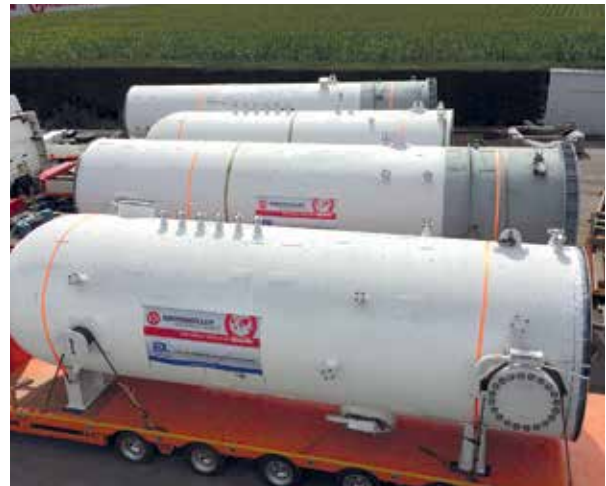
Abb. 4: OAO Naftan, Nowopolozk, Belarus: Engineering und Lieferung von zwei Extraktionskolonnen für Umbau PDA-Anlage

H&R Ölwerke Schindler GmbH, Hamburg: Neubau und Erweiterung PDA-Anlage